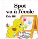
Spot va à l'école par Eric Hill