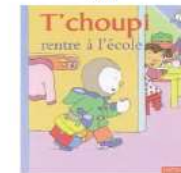
T'choupi rentre à l'école de Thierry Courtin