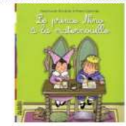
Le Prince Nino à la Maternouille par Anne-Laure Bondoux et Roser Capdevila.