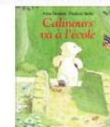
Calinours va à l'école d'Alain Broutin