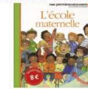
L'école maternelle chez Gallimard, mes premières découvertes des notions