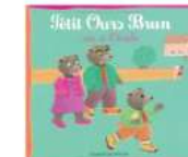
Petit Ours Brun va à l'école par Danièle Bour